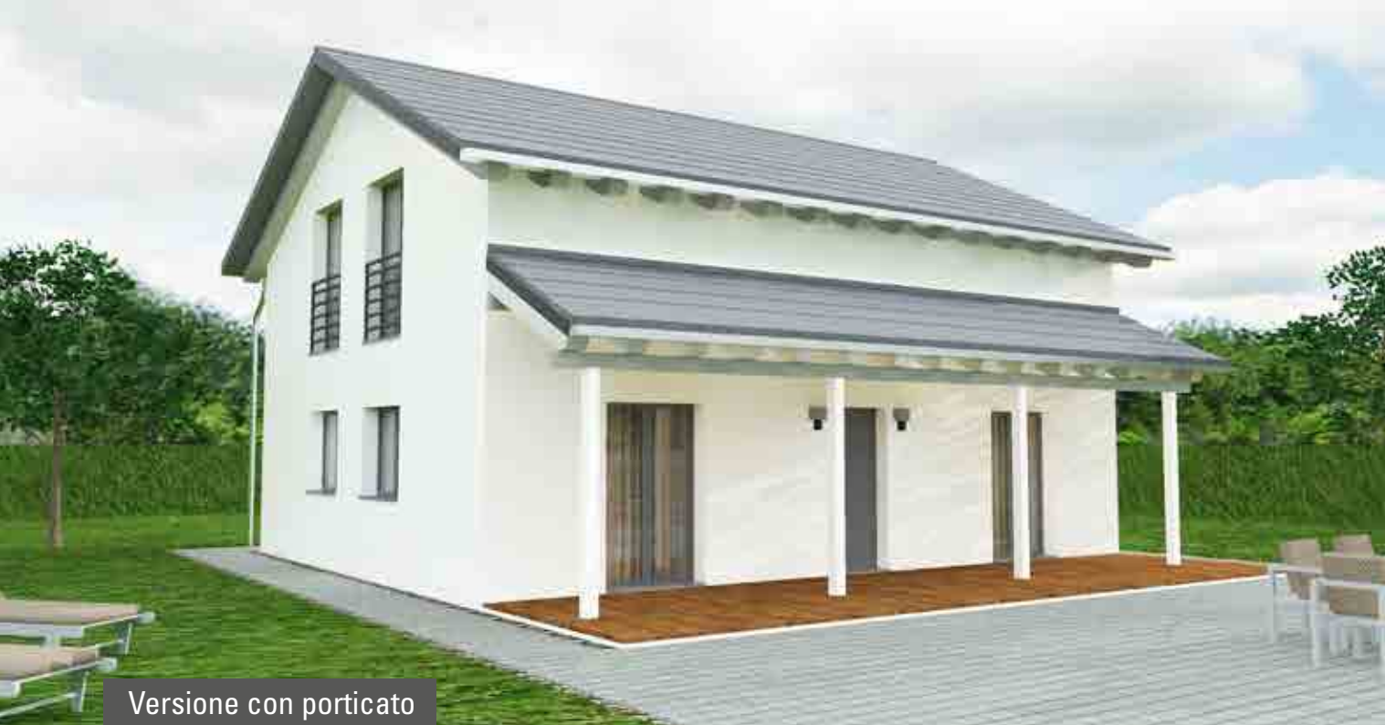
Versione con porticato