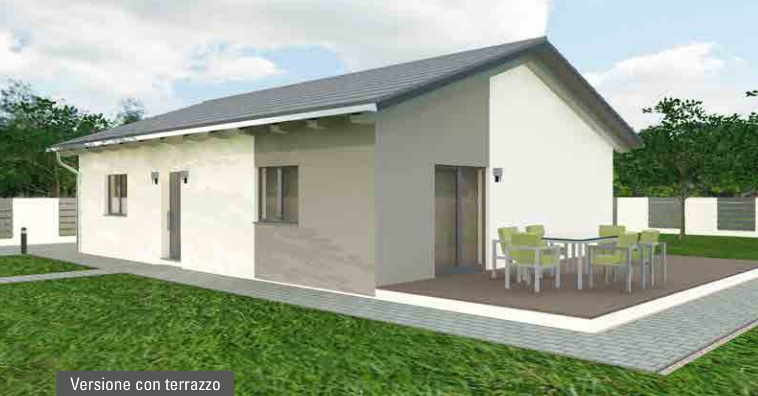
Versione con terrazzo