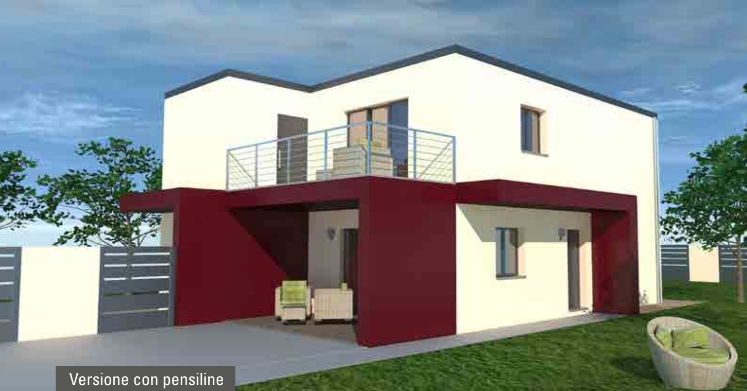
Versione con pensiline