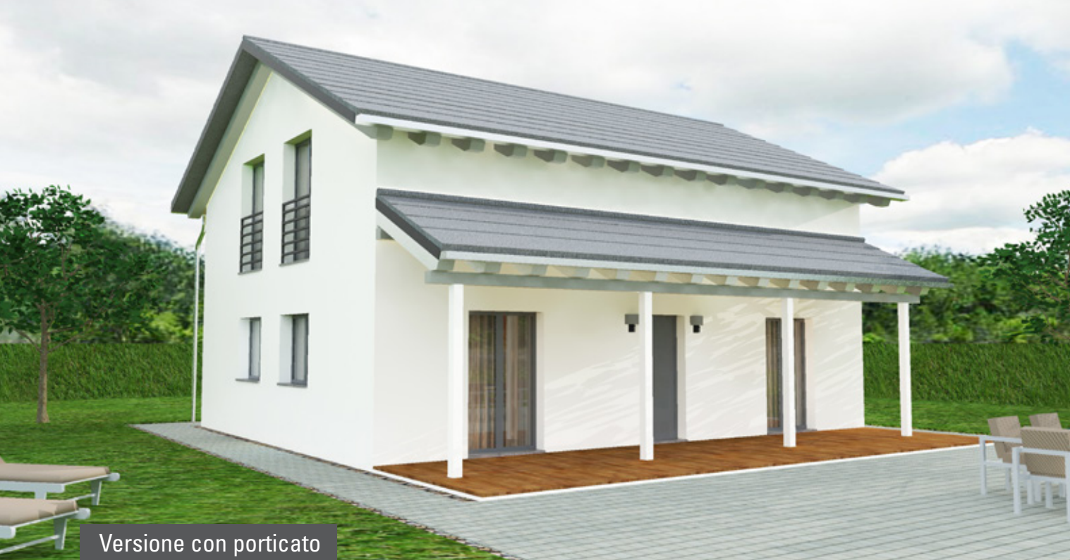
Versione con porticato