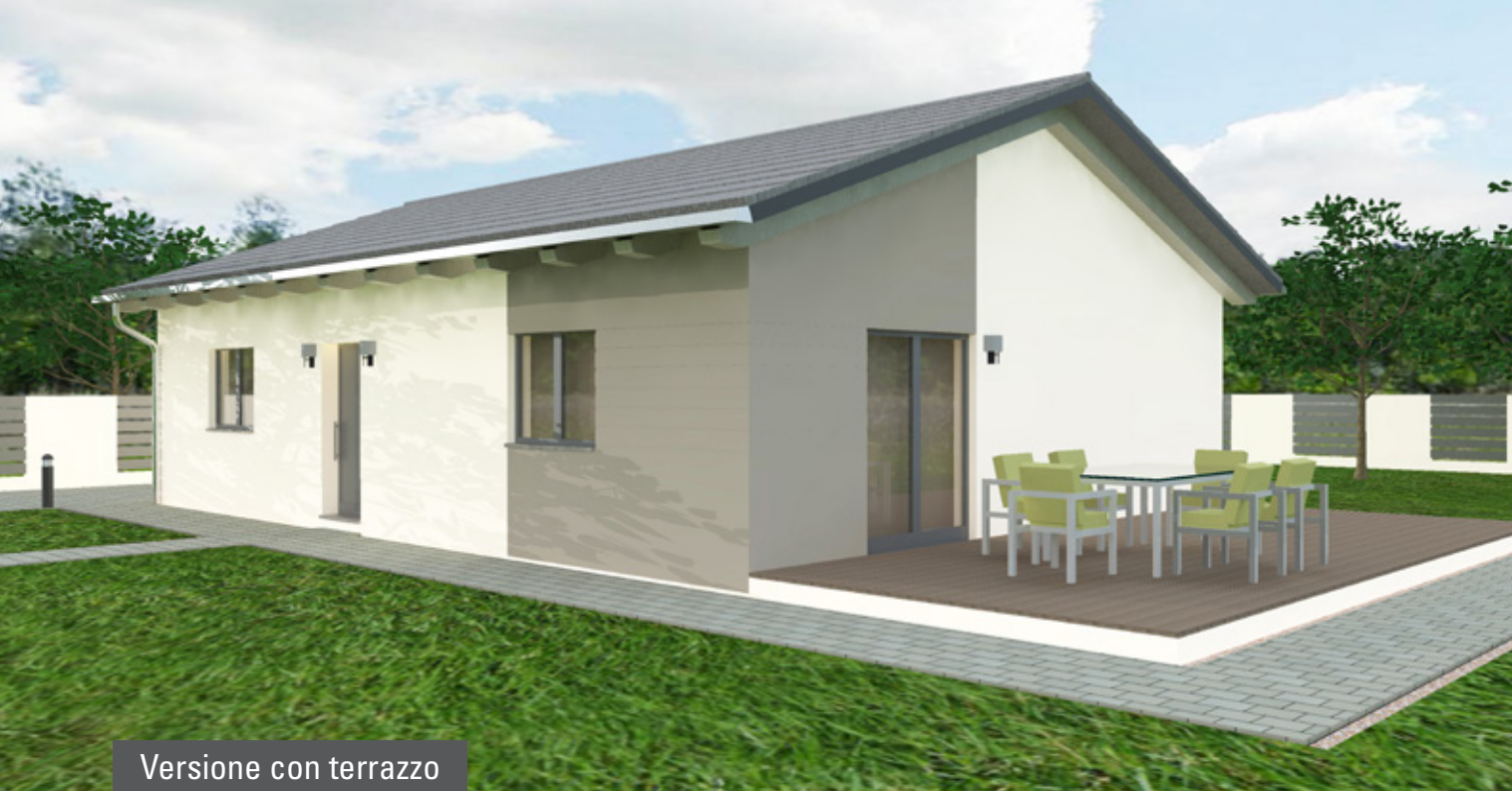
Versione con terrazzo