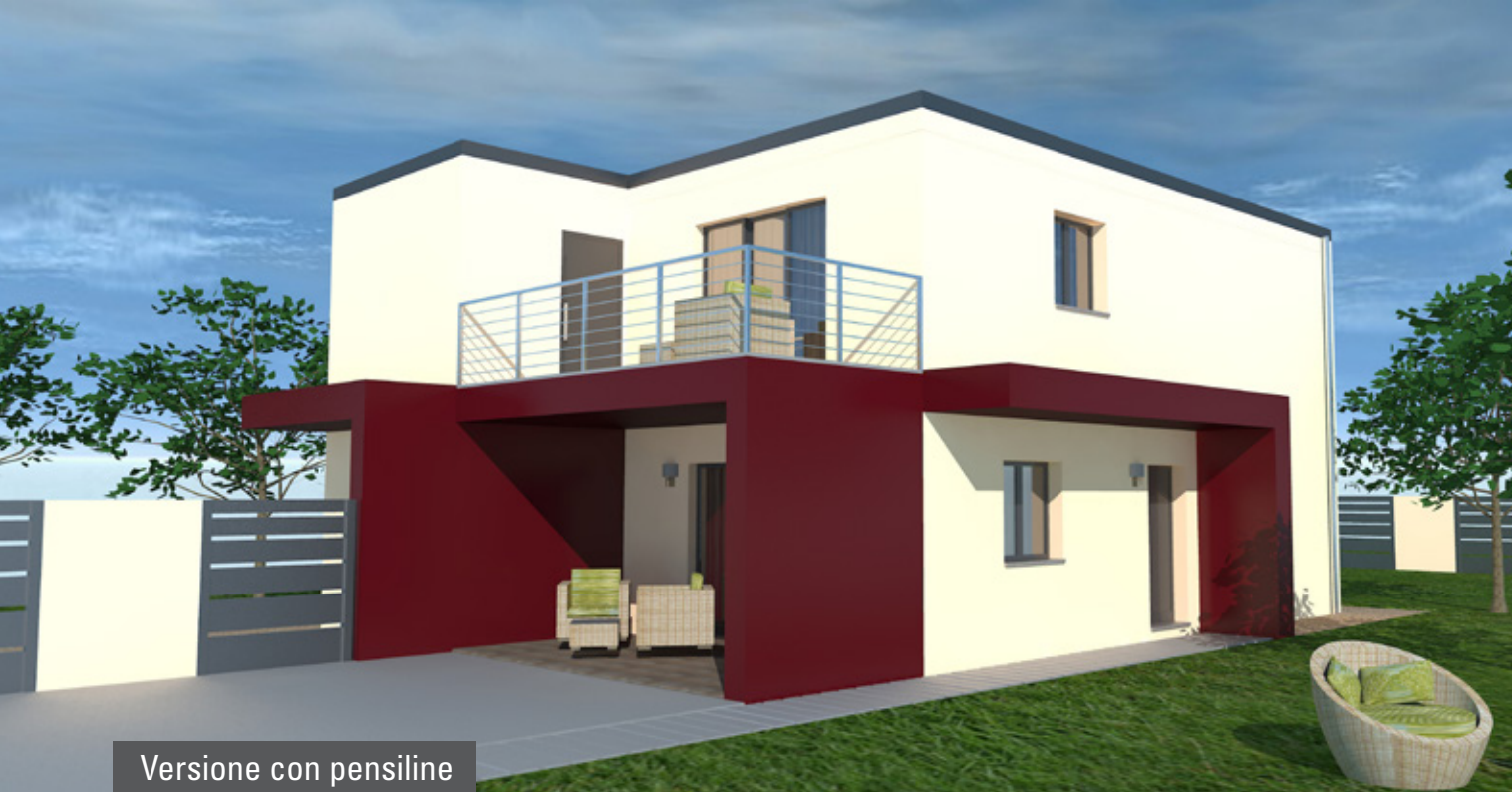
Versione con pensiline