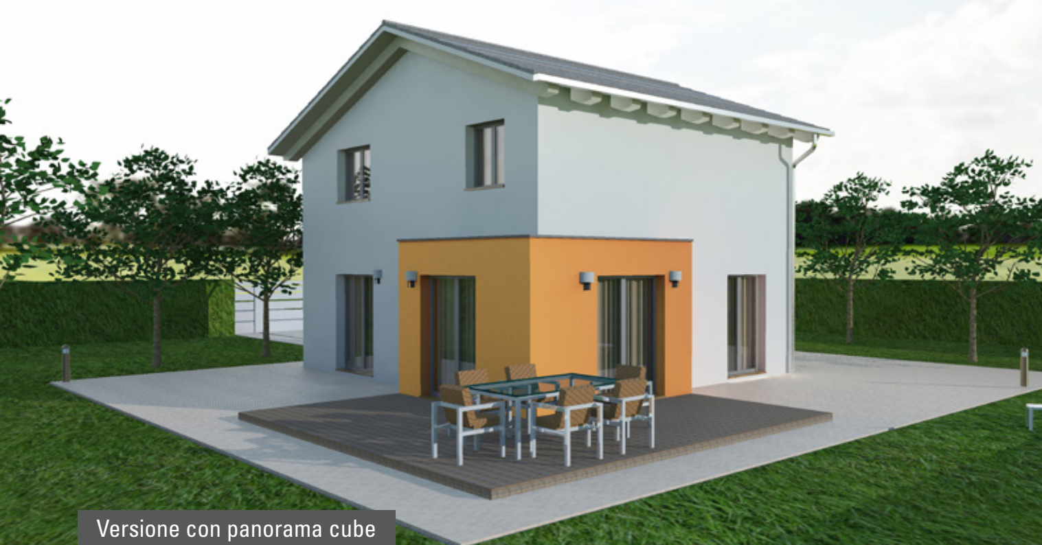
Versione con panorama cube