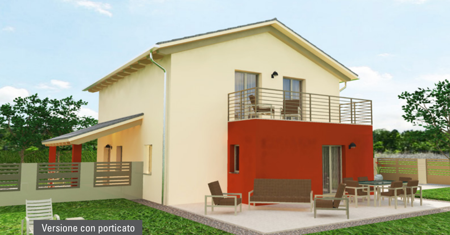
Versione con porticato