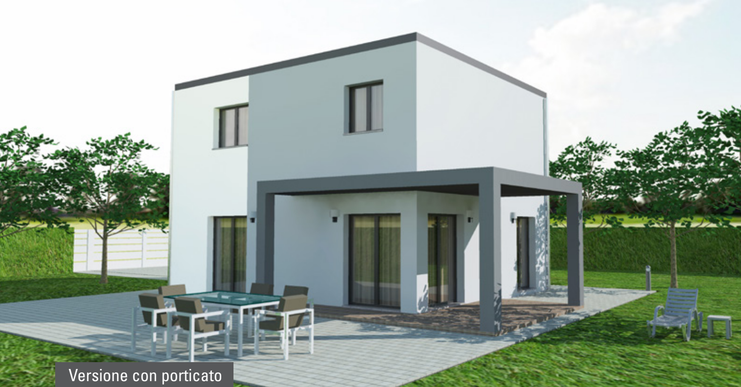
Versione con porticato